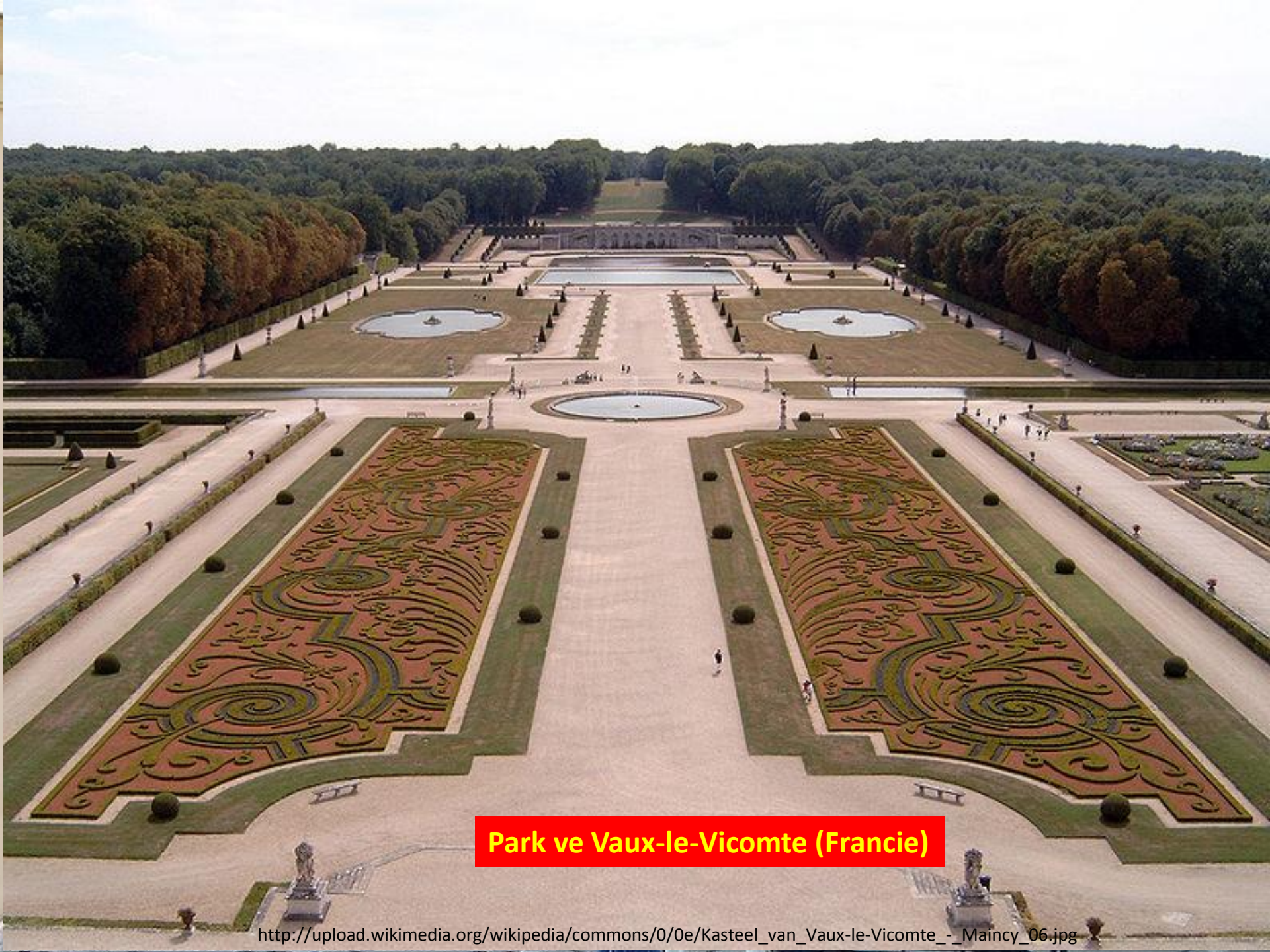
Park ve Vaux-le-Vicomte (Francie)