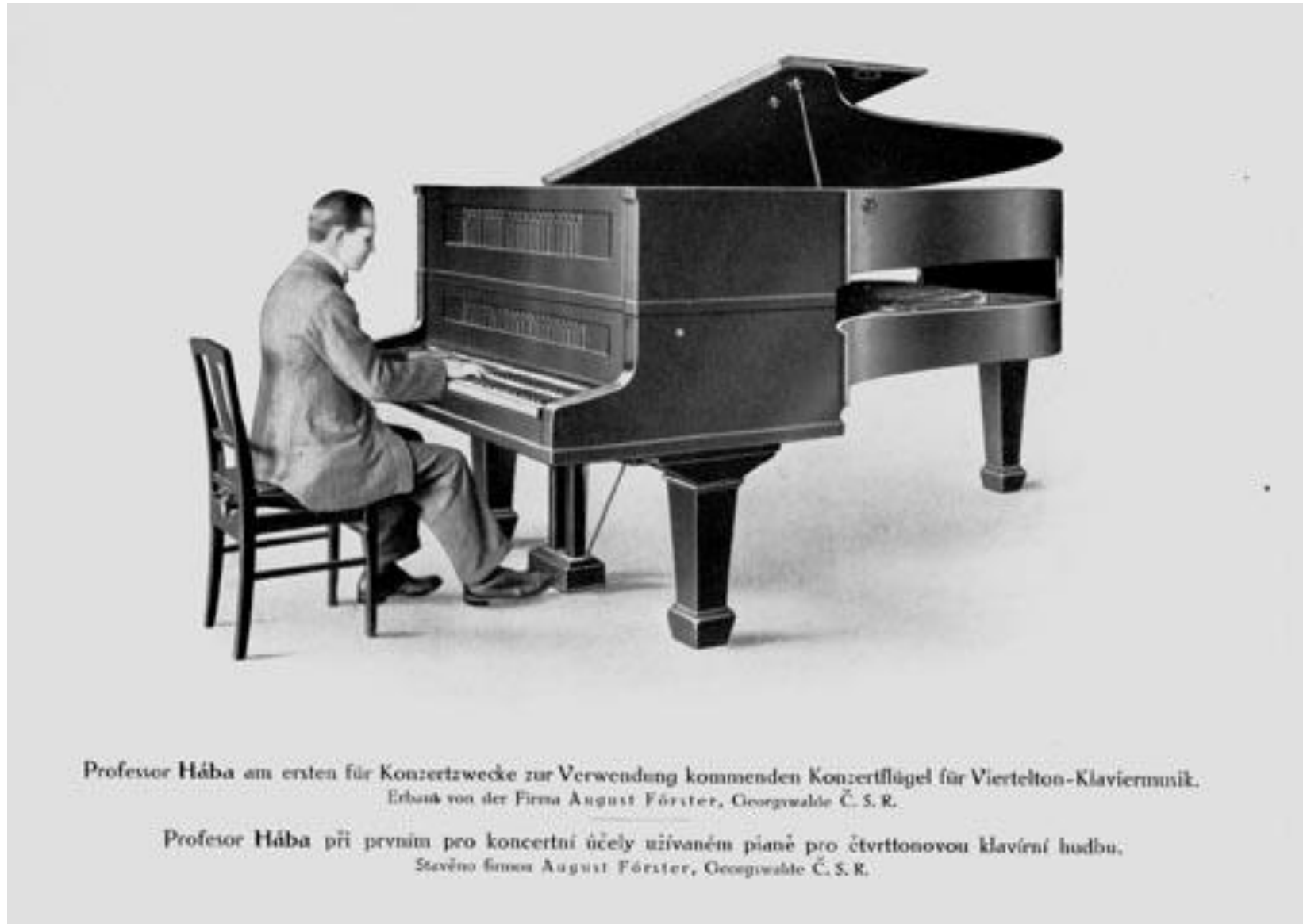
Professor Hába am ersten für Konzertzwecke zur Verwendung kommenden Konzertflügel für Viertelton-Klaviermusik. Erbaut von der Firma August Förster, Georgenwalde Č. S. R.

Profesor Hába při prvním pro koncertní účely užívaném pianě pro čtvrttonovou klavírní hudbu. Stavěno firmou August Förster, Georgenwalde Č. S. R.