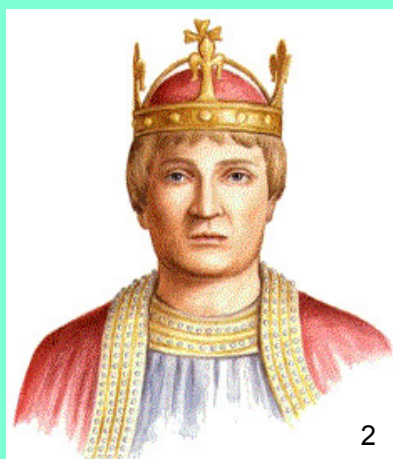
Vladislav II. (1158)