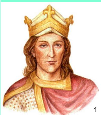
Vratislav II. (1085)