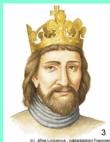
Přemysl Otakar I. (1212)